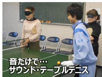
音だけで... サウンド・テーブルテニス