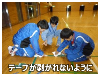
テープが剥げないように