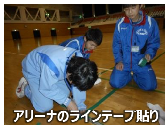
アリーナのラインテープ貼り