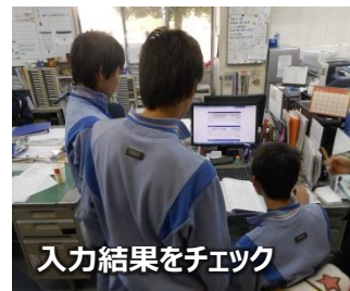
入力結果をチェック