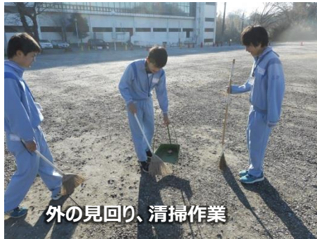
外の見回り、清掃作業