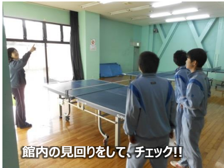
館内の見回りをして、チェック!!