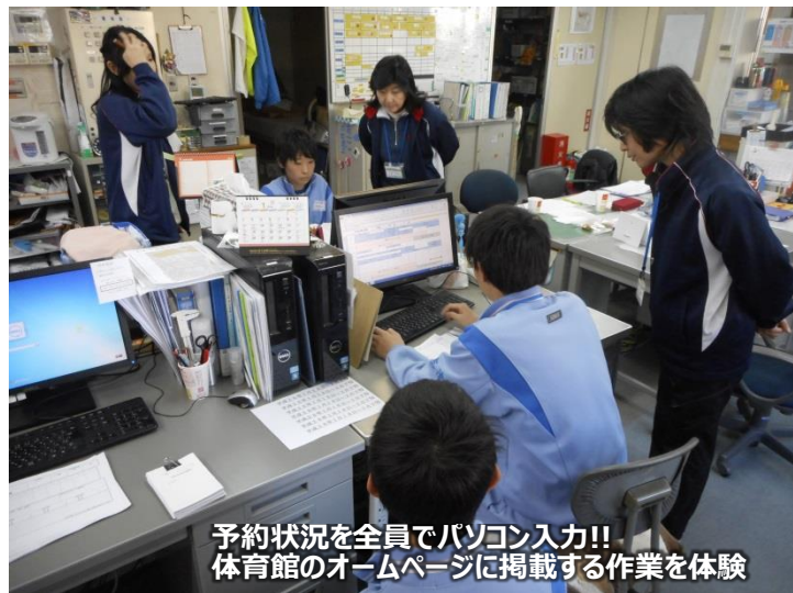
予約状況を全員でパソコン入力!! 体育館のホームページに掲載する作業を体験