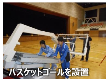
バスケットゴールを設置