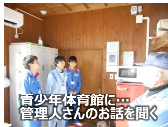
青少年体育館に... 管理人さんのお話を聞く