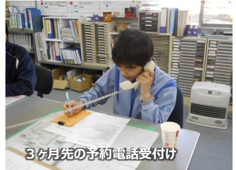
3ヶ月先の予約電話受け