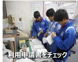
利用申請書をチェック