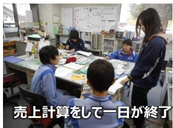
売上計算をして一日が終了

本当にたくさんのお仕事や体験をしていただきました♪ お疲れ様でした！ありがとうございました。研修担当 ○感想 1: いろんなことを学べて、楽しかったです。今度は、職場体験外で来てみたいと思いました。 ○感想 2: 予約電話の対応のとき思っていたよりも声がでなくて緊張しました。いい体験になりました!! ○感想 3: 最初の電話はすごく緊張したけどいい体験になりました。またこういう機会があればいいなと思いました。