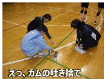
えっ、ガムの吐き捨て