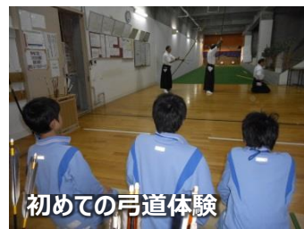
初めての弓道体験