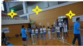
キャッチ・ザ・スティック