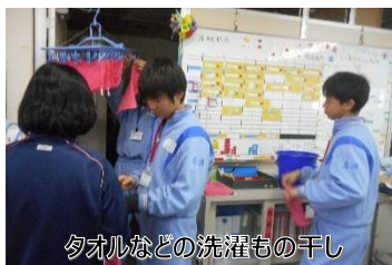
タオルなどの洗濯もの干し