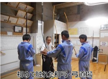
初めて触れた和弓・弓道場