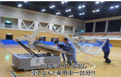
バスケットゴール出し 重さなんと乗用車一台分!!