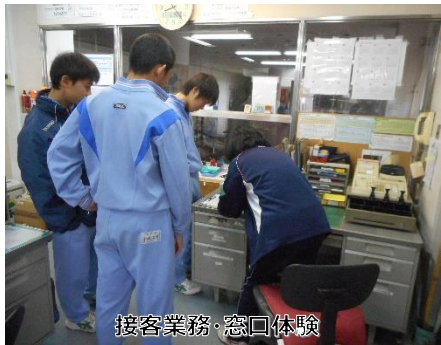
接客業務・窓口体験