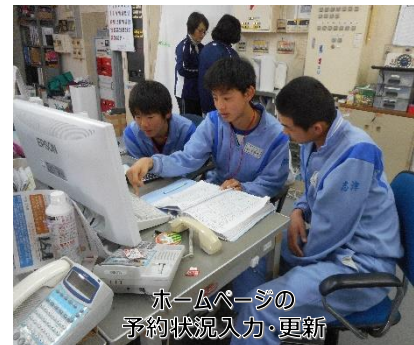
ホームページの 予約状況入力・更新