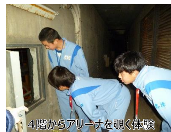
4階からアリーナを覗く体験