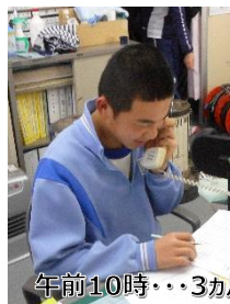
午前10時・・・3ヵ月先の電話予約。復唱をしながら予約を確認