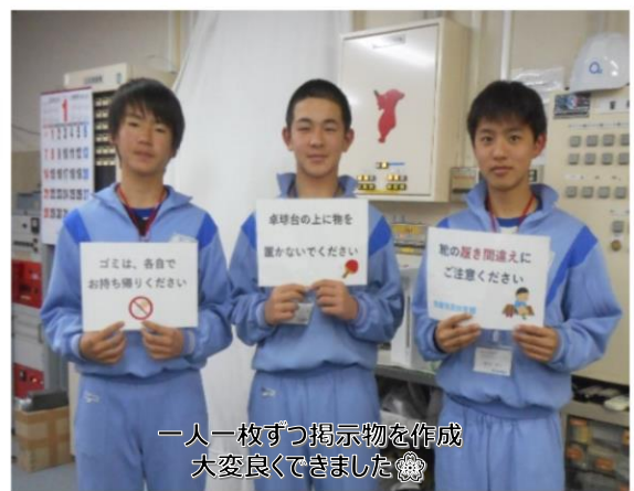
一人一枚ずつ掲示物を作成 大変良くてきました🌸