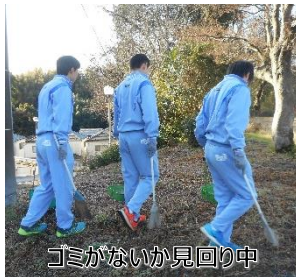
ゴミがないか見回り中