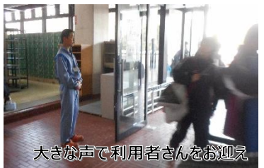
大きな声で利用者さんをお迎え