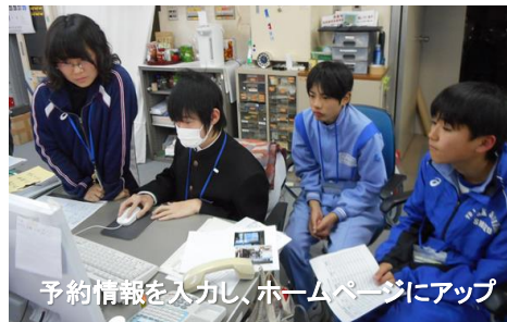
予約情報を入力し、ホームページにアップ