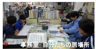
事務室 自分たちの居場所

研修担当 一生懸命に取り組んでくれました。何かを感じてくれればいいな、と思います。