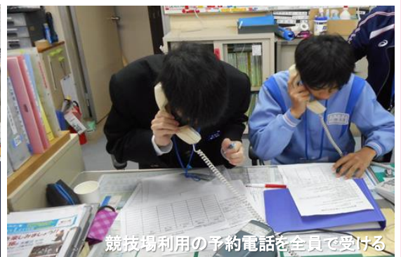
競技場利用の予約電話を全員で受ける