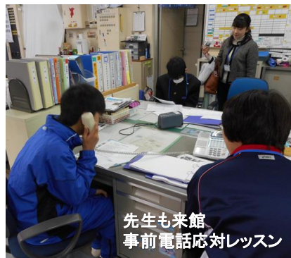
先生も来館 事前電話対応レッスン