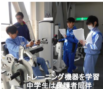
トレーニング機器を学習 中学生は保護者同伴