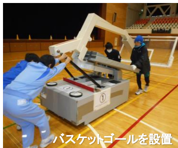
バスケットゴールを設置