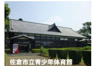
佐倉市立青少年体育館